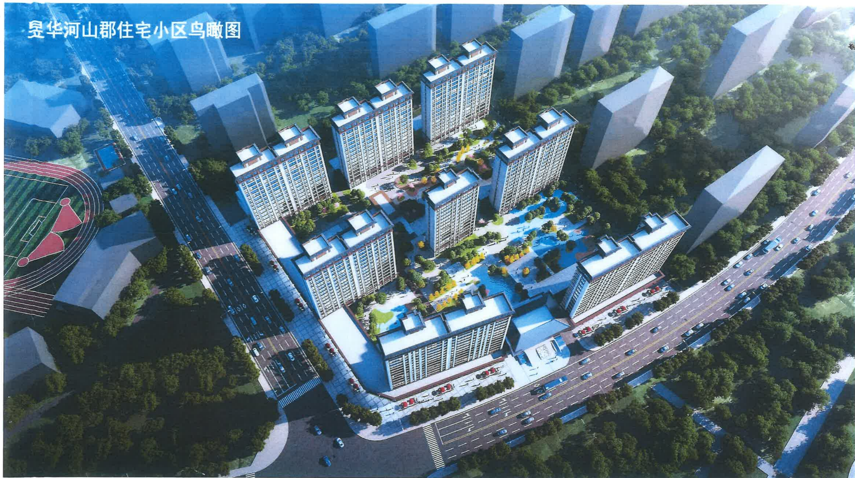
晁华河山郡住宅小区鸟瞰图